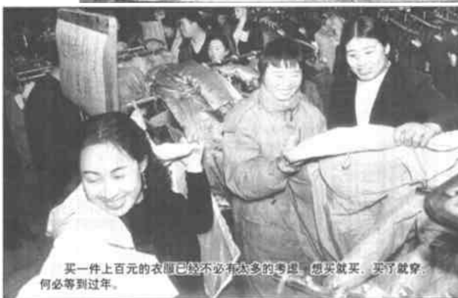
买一件上百元的衣服已不必有太多的考虑，想买就买，买了就穿，何必等到过年。