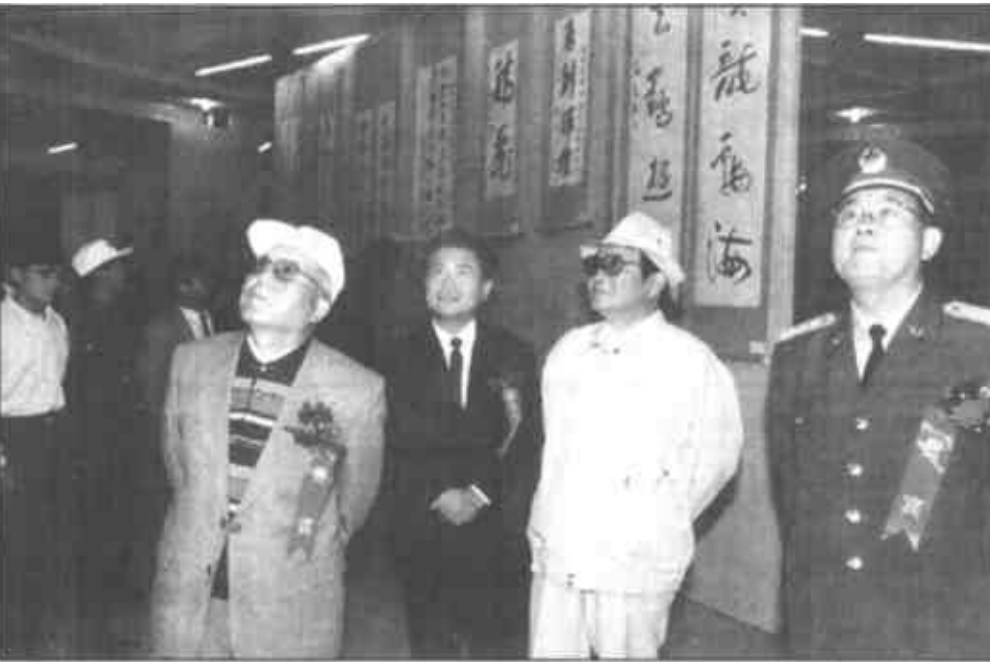
10月15日，市委书记国家森陪同省和济南军区的老领导梁步庭、李振、张大恒观看庆祝建市十五周年美术、书法、摄影展。

各位领导、同志们、朋友们，回首过去，我们无比自豪；展望未来，我们任重道远。全市人民依靠自己的勤劳智慧，已经创造了辉煌的昨天，也完全能够创造更加美好的明天。我们坚信，在省委、省政府的正确领导下，经过全市人民的不懈努力，黄河三角洲开发建设一定会结出更加丰硕的成果，二十一世纪的东营一定会更加繁荣昌盛。我们对美好的明天充满信心。让我们更加紧密地团结在以江泽民同志为核心的党中央周围，同心同德，艰苦创业，不断夺取改革与发展的新胜利，为东营市更加美好的明天而努力奋斗！