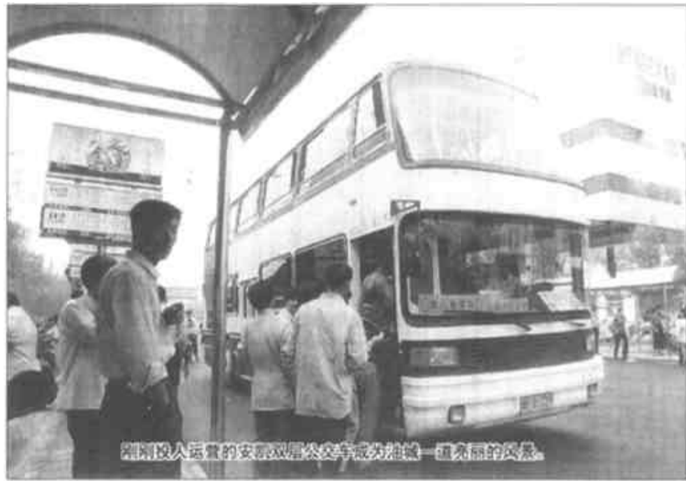
东营人喜爱的双层豪华公交车成为油城一道亮丽的风景线。

市区公交变化也非常迅速。从建市之初的没有公交公司，到1990年的十几辆公交车，每天100个班次；时至今日，