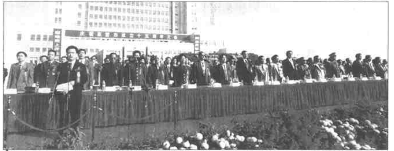
大会主席台。