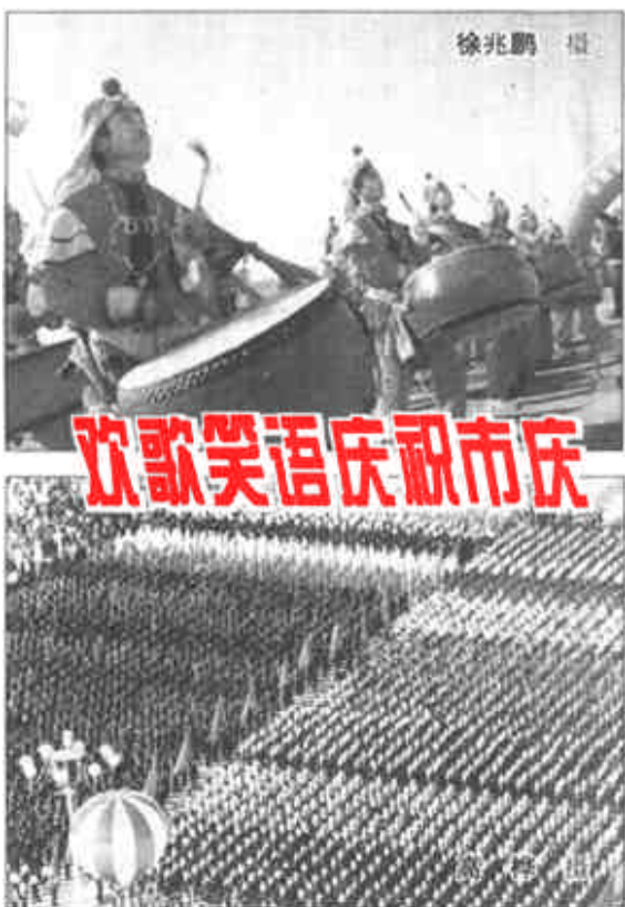
欢歌笑语庆祝市庆

回顾光辉的历程，我们欣喜地看到，建市以来的十五年，是油地携手、军民团结，共铸辉煌的十五年；是东营昂首阔步前进，发生重大历史变化的十五年；是社会生产力空前发展，综合经济实力大大增强的十五年；也是人民生活日益改善，社会文明程度显著提高的十五年。（下转第三版）