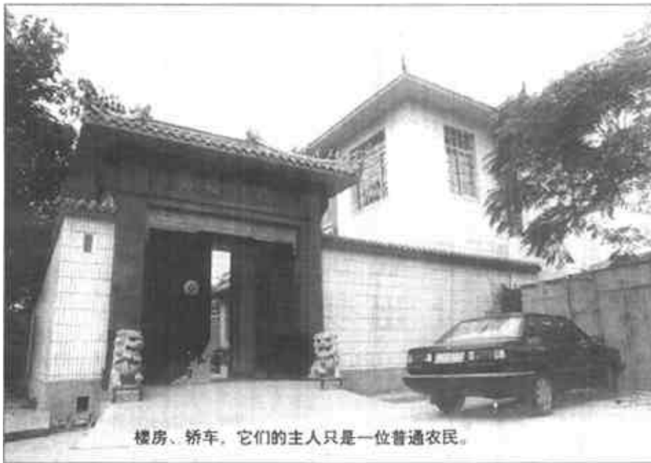
楼房、轿车。它们的主人只是一位普通农民。