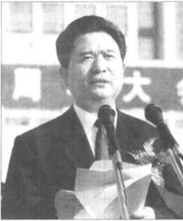
市委副书记、市长石军在庆祝大会上讲话。