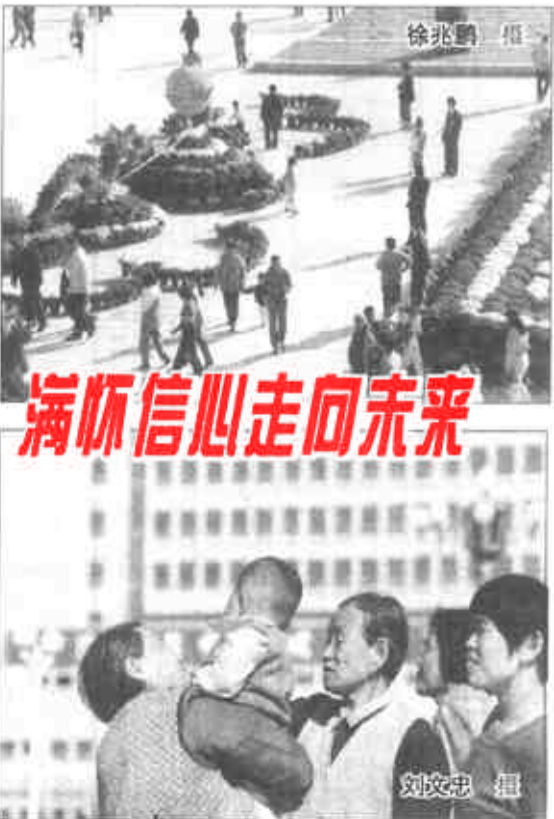
满怀信心走向未来