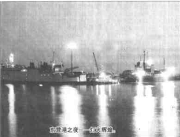
东营之夜——灯火辉煌。

确实，服装是一个城市的晴雨表，从中可以看出一个地区商业的繁荣程度和人们的生活水平。