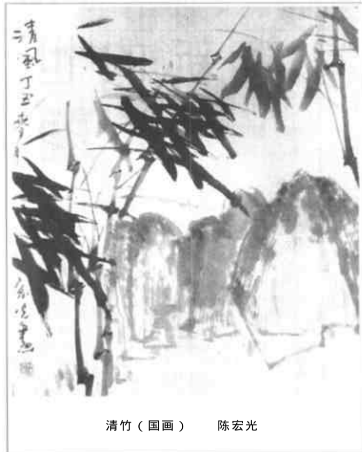
清竹 (国画) 陈宏光

黄河奔海，气势浑弘； 天上之水，豪聚东营。 物华天宝，人杰地灵； 齐心共创，华夏文明。 韩进 / 诗书