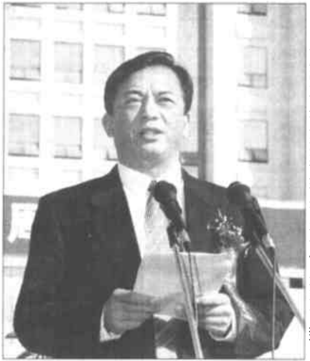
市委副书记、市长石军在庆祝大会上讲话。