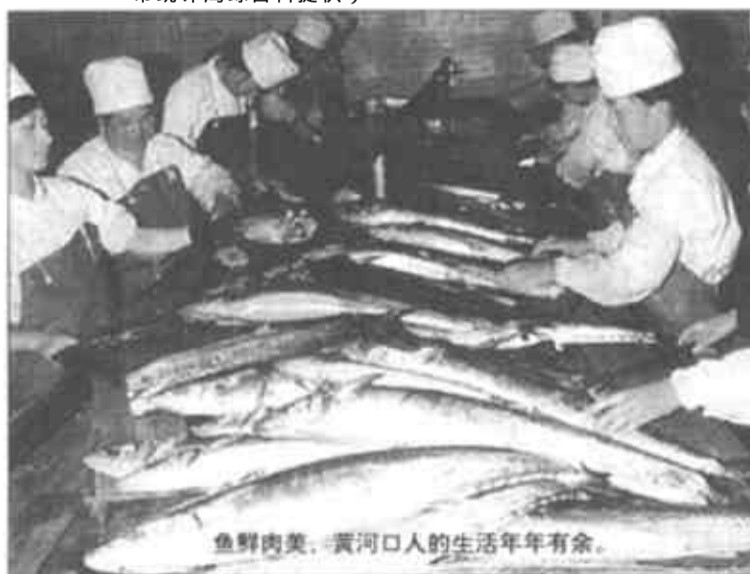
鱼鲜肉美，黄河口人的生活年年有余。